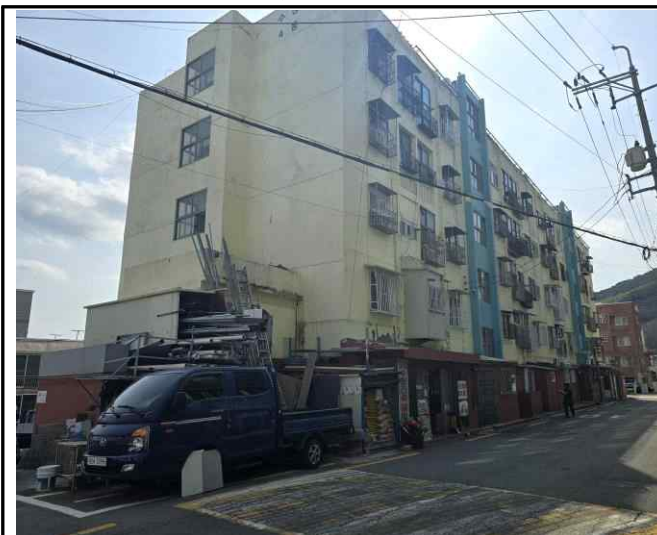
수정아파트 4호동 전면 외부전경