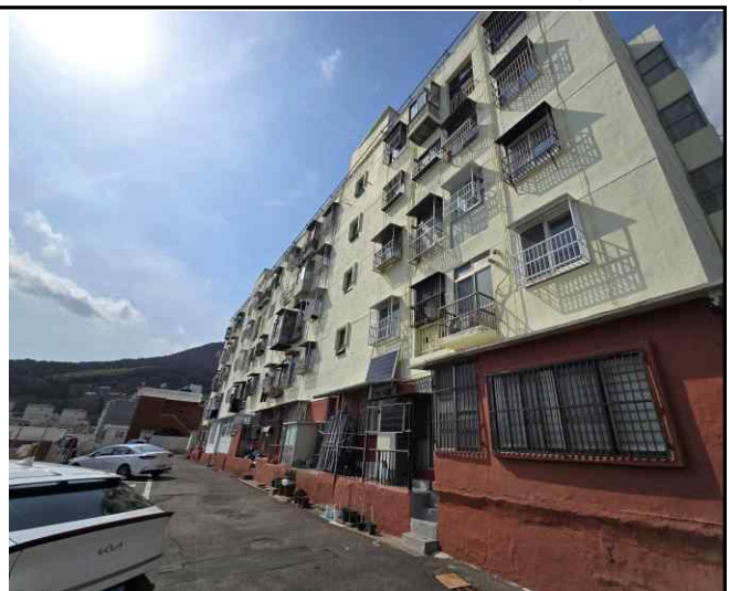
수정아파트 4호동 후면 외부전경