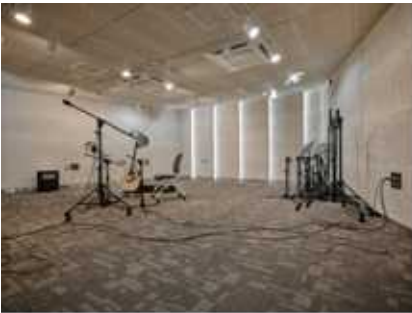
메인홀 55.07㎡, 16.66py

소규모 현악, 합창까지 녹음 가능한 메인 레코딩 부스 겸 다목적 홀 (U87Ai, 22475E, C414XL II, KM185 Pair, P-84 Pair, Earthworks Mic set, P16 Monitoring 등)