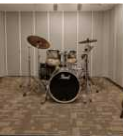
드럼룸 17.20㎡, 5.20py

16In 22Out 아날로그/디지털 레코딩, 믹싱, 에디팅 컨트롤룸 겸 MIDI 작업실 (Protools, Apollo X6, PMC Result 6, Cubase pro 10, Logic Pro X, Arturia 61 Keys, Komplete 12 Ultimate, BAE 1073 PreAmp 등)