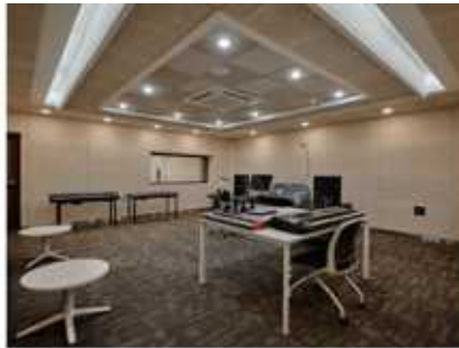
컨트롤룸A 43.38㎡, 13.12py

소규모 현악, 합창까지 녹음 가능한 메인 레코딩 부스 겸 다목적 홀 (U87Ai, 22475E, C414XL II, KM185 Pair, P-84 Pair, Earthworks Mic set, P16 Monitoring 등)