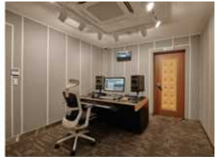
컨트롤룸B 12.61㎡, 3.81py

24In 24Out 아날로그/디지털 Hybrid 레코딩, 믹싱, 마스터링 컨트롤룸 (Protools HD, Api Box2 Console, PMC TwpTwo 8, Antelope Converter, 10MX Atomic Clock, Neve/Millenia/ Api Preamp UAD-2, Bricasti M7 Reverb 등)