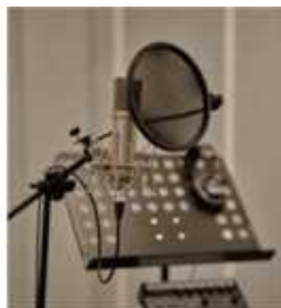
보컬룸 9.72㎡, 2.94py

드럼레코딩 부스 겸 합주실 (Sonor SQ1 Drum Set, Mesa MarkV guitar Amp, Aguilar Bass Amp, Synthesiser 88 keys, 합주용 PA 등)