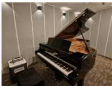
피아노룸 26.87㎡, 8.13py

그랜드 피아노 레코딩 부스 겸 합주실 (C7X Grand Piano, Gretsch Drum Set, Fender Hotrod guitar amp, MarkBass Amp, Synthesiser 76/88 Keys, 합주용 PA 등)