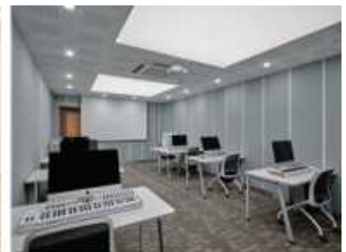
교육실 29.87㎡, 9.04py

그랜드 피아노 레코딩 부스 겸 합주실 (C7X Grand Piano, Gretsch Drum Set, Fender Hotrod guitar amp, MarkBass Amp, Synthesiser 76/88 Keys, 합주용 PA 등)